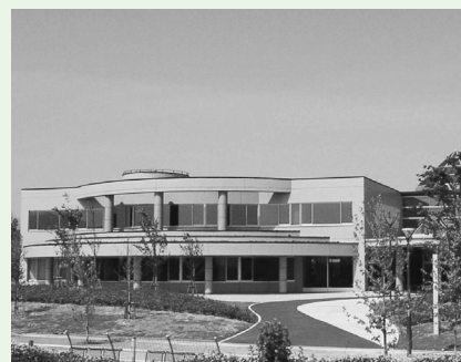
▲津市ビジネスサポートセンターがある「あかつピア」