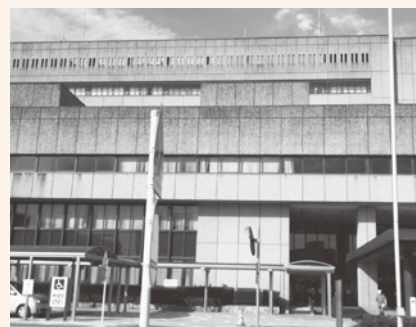
▲津市政の刷新目指し、今がんばりどき